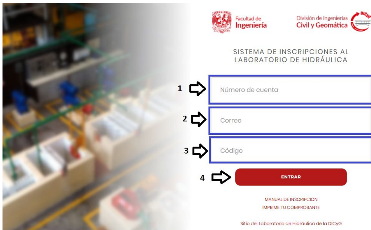
Figura 1.1. Vista de acceso al SILH.

Posteriormente, se desplegará una vista como la mostrada en la Figura 1.1.