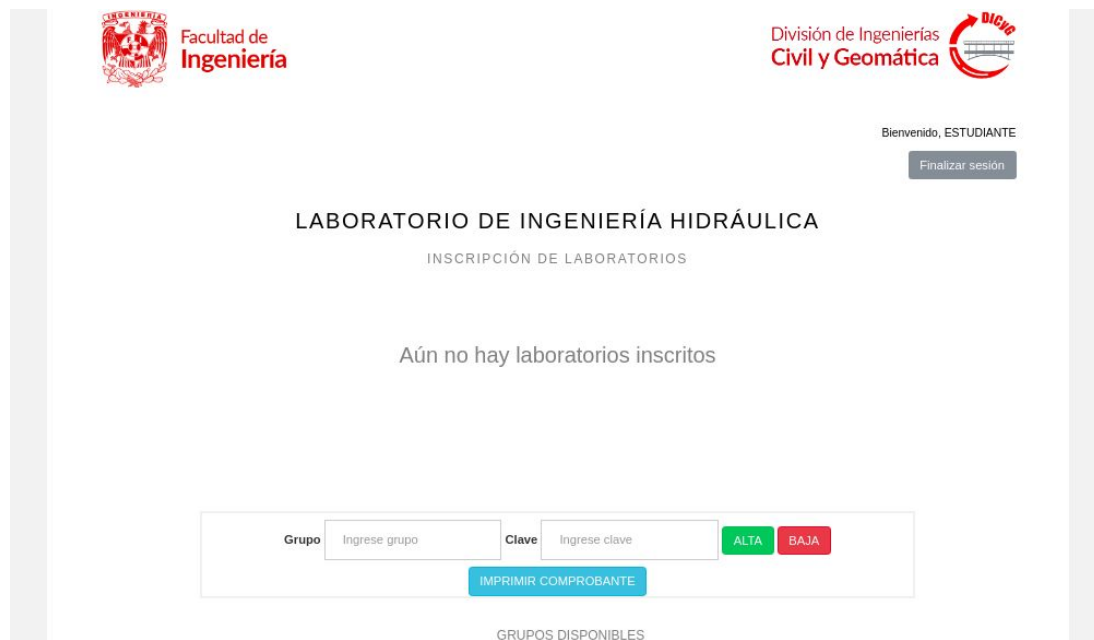
Figura 1.2. Vista principal (parte superior).

Una vez que se han validado los datos y que sean correctos, se mostrará una vista como las Figura 1.2 y Figura 1.3, en la que podrás interactuar para realizar los movimientos descritos en la siguiente sección.